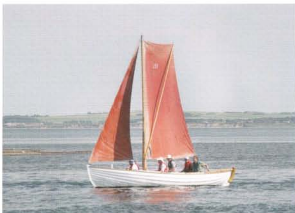
Ingeborg Munch – Sjægt bygget 1987

Det maritimhistoriske bliver en fællesnævner for aktiviteterne i Fjordkulturen. Ligeledes bliver det et mål i sig selv at bringe mange mennesker sammen på tværs af generationer omkring aktiviteterne, som formidler og bevare kulturelle og menneskelige værdier i håndværk og håndlag.