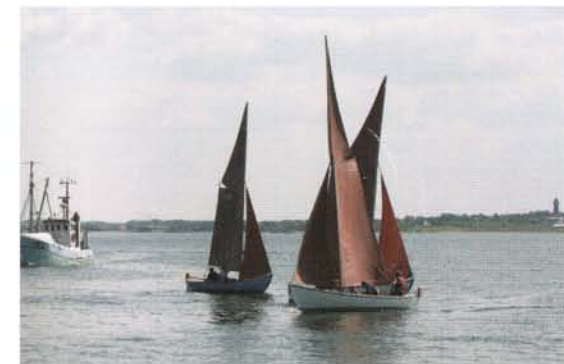
Sjægte i kapsejlad – Venø Rundt

Den der besøger Nordvestjysk Fjordkultur, når der er fuld gang i den, vil se at der bliver bygget nye joller, eller repareret gamle bådtyper, som har været kendt på Limfjorden fra gammel tid. Som medlem af Kulturen kan man arbejde på sine egne projekter, man kan også komme blot for hyggens skyld og få en god snak over en kop kaffe.