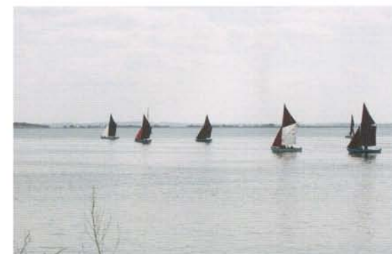
Sjægte i kapsejlad – Venø Rundt