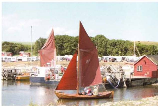
Lille Løffe – Smakkejolle bygget 1978

I vinterhalvåret – oktober til og med april, er der klubaftener hver tirsdag kl. 19.00 i klubbens lokalerne på Havnevej 6.