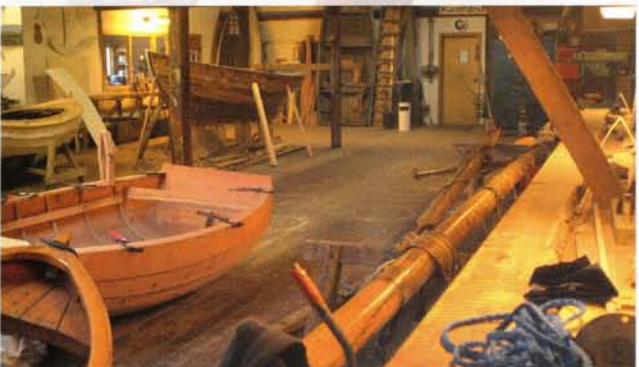
Nybygning og vedligeholdelse i værkstedet