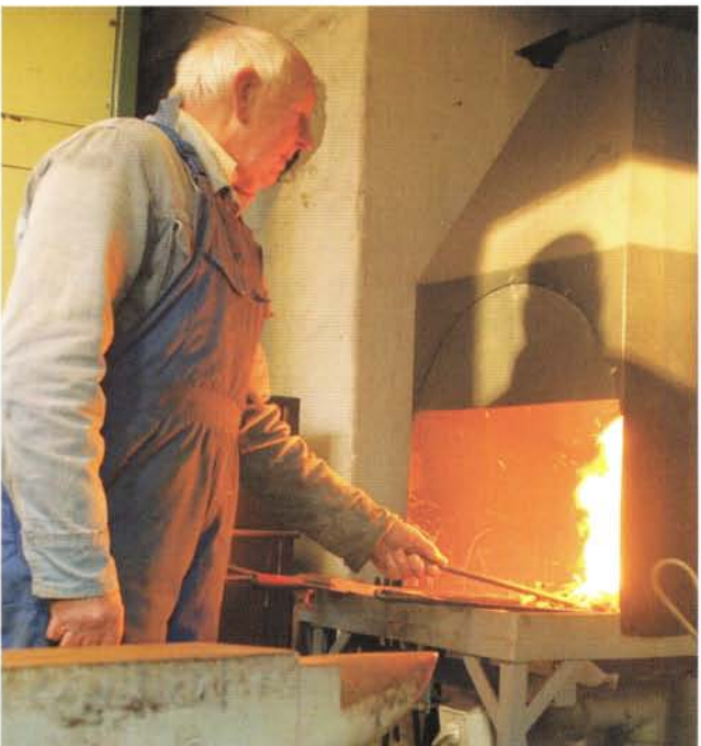
Smedeværkstedet med ambolt og esse