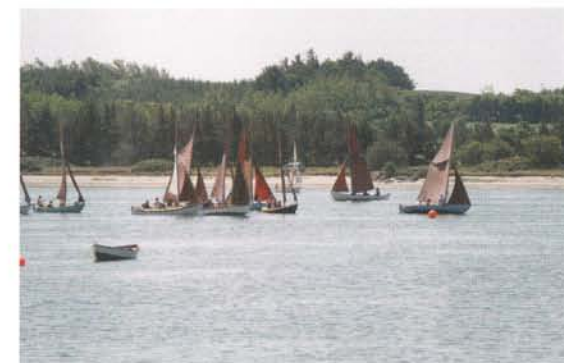
Sjægte i kapsejlad – Venø Rundt